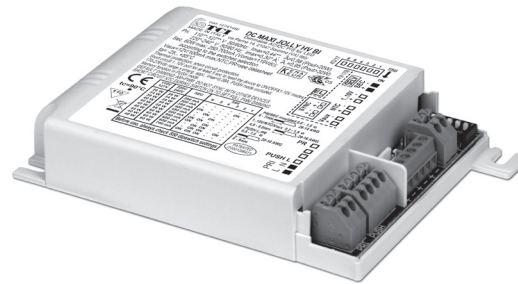
DC MAXI JOLLY HV BI