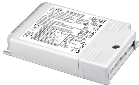
DC MAXI JOLLY HV